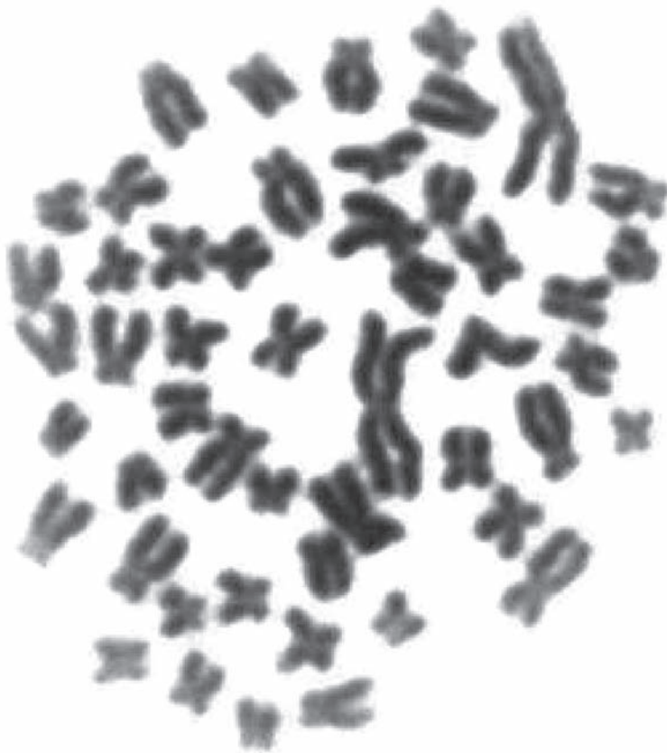
Fig. 2. Metafase de B. henni . Presenta un par cromosómico de gran tamaño, característico del género Brycon . Giemsa 5%.