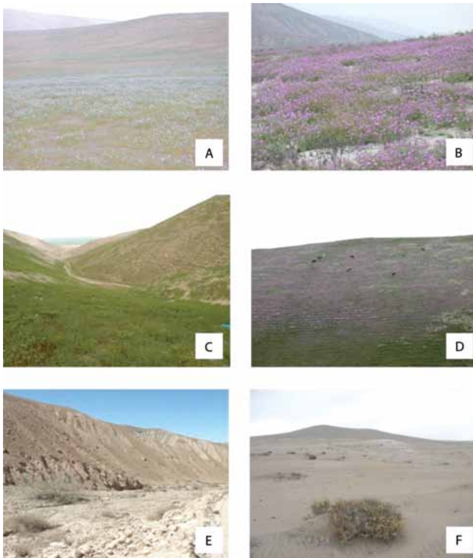
Fig. 1. Comunidades vegetales. (A) Nolano spathulatae - Palauetum dissectae y (B) Hoffmannseggio mirandae - Palauetum weberbaueri , en las lomas de Mejía; (C) Nolanetum scaposospathulatae y (D) Palauetum camanensis-weberbaueri , en las lomas de Camaná; (E) Comunidad de Atriplex rotundifolia y Ephedra americana con Schinus molle en el valle Atico-Caravelí; (F) Comunidad marginal de Atriplex rotundifolia y Ephedra americana entre Ocoña y Camaná.